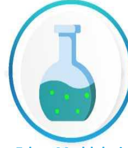
İlaç Etken Maddeleri ve Katkıları