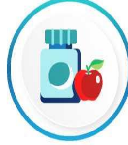
Gıda ve Diyet Takviyeleri